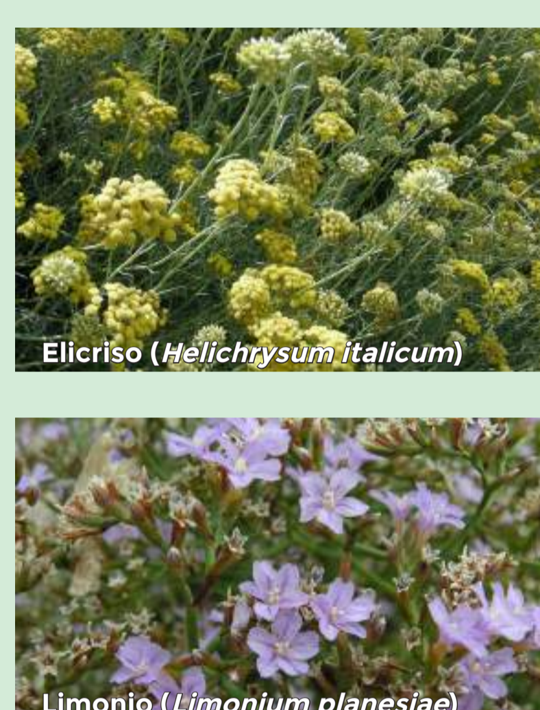
Elicriso ( Melicthys aurea )