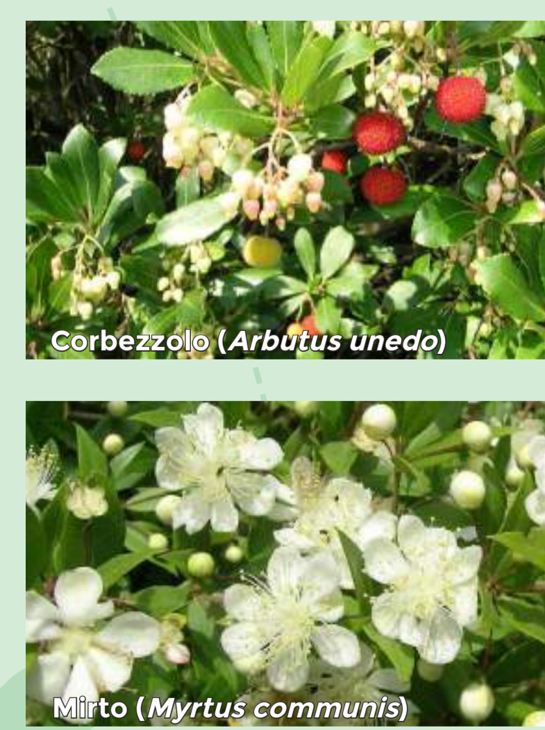
Corbezzolo ( Arbutus unedo )

Le boscaglie e le macchie crescono dove il bosco di leccio non ha avuto tempo di riprendersi oppure dove le condizioni ecologiche sono troppo rigide per la sua ricostituzione. Le piante tipiche sono l'erica, il corbezzolo, l'alaterno, la ginestra, il mirto, il lentisco. Lungo le coste rocciose di quasi tutte le Isole il ginepro fenicio ( Juniperus phoenicea ssp. turbinata ) forma fasce omogenee, dando origine a boscaglie impenetrabili. A Pianosa risente negativamente della presenza del Pino di Aleppo, una conifera che cresce molto velocemente e usata dall'uomo per rimboschimento.