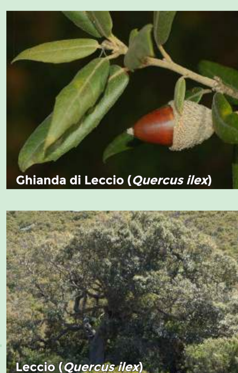
Chiana di Leccio ( Quercus ilex )