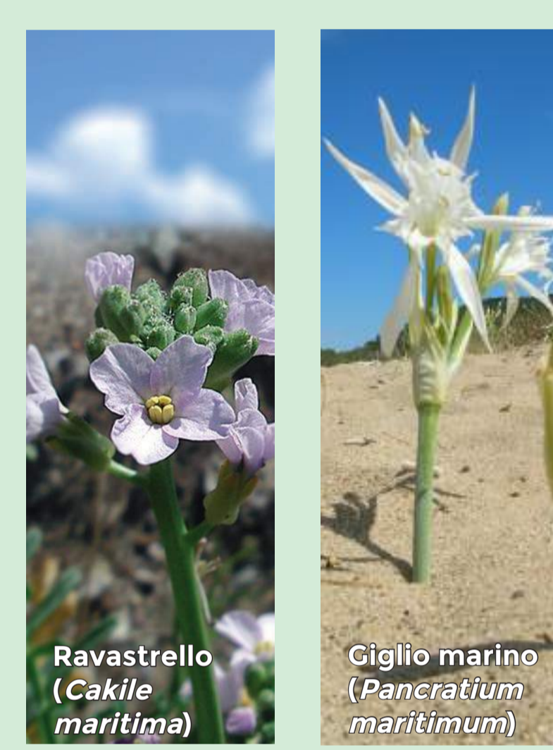
Ravastrello ( Cakile maritima )

È un ecosistema composto da vari microhabitat e nell'Arcipelago Toscano si trova solamente a Lacona (Capoliveri). Il vento e la sabbia determinano nelle piante particolari adattamenti. Il ravastrello ( Cakile maritima ) che cresce molto vicina al mare, ha lunghe radici indispensabili per ancorarsi al suolo incoerente. Dove le dune si consolidano sono presenti altre specie: il Giglio marino ( Pancretium maritimum ) e il Ginepro coccolone ( Juniperus oxycedrus subsp. macrocarpa ). Questi ambienti possono essere danneggiati dall'erosione o dall'eccessivo calpestio.