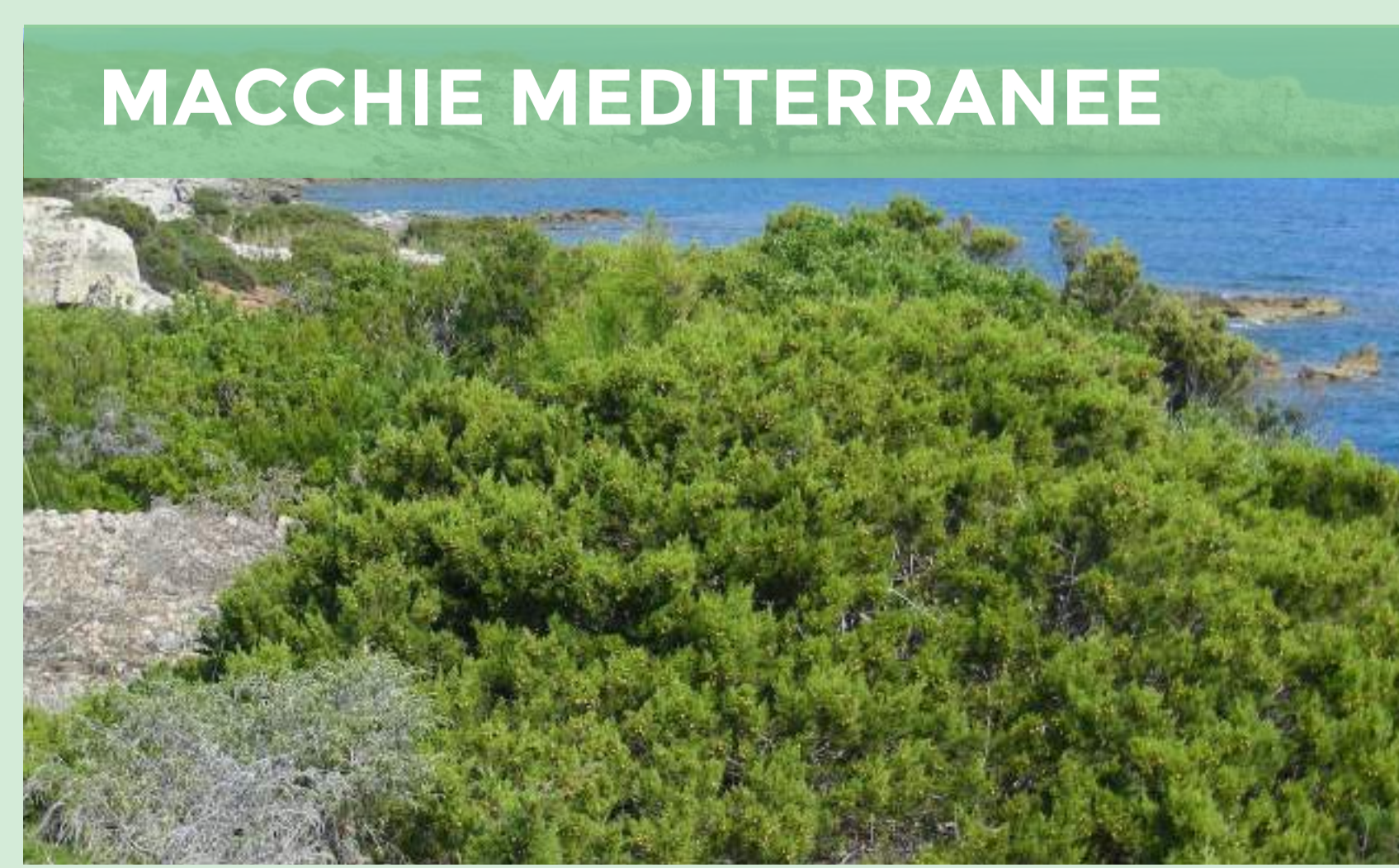
Mirto ( Myrtus communis )