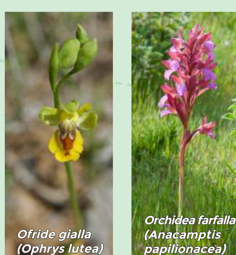
Ofride gialla ( Ophrys lutea )